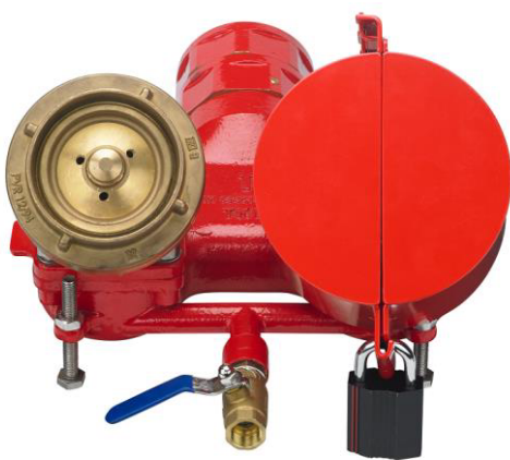
FW-Kupplungssicherung einzeln (Schloss nicht im Lieferumfang enthalten)