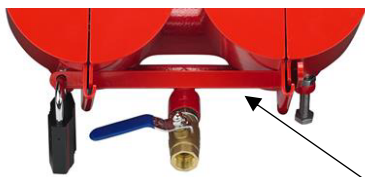
Schieber für 2-fach-Sicherung Artikel-Nr.: 509045

Beim Einsatz mehrerer in Reihe angeordneter Kupplungen können diese über einen Schieber gemeinsam verschlossen werden. Bitte geben Sie uns im Bedarfsfall die Länge des erforderlichen Schiebers an. Die Länge berechnet sich durch den Abstand der Mittelpunkte der äußersten Kupplungen + 50 mm (siehe Skizze rechts).